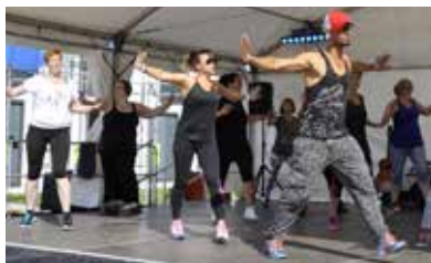
Zumba® Team Christophsbad