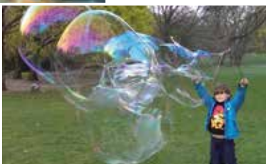
Riesenseifenblasen zum Staunen und Mitmachen