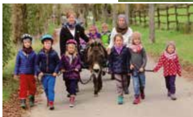
Eselführung über das Gelände Treffpunkt: 14 Uhr, beim Hubschrauberlan- deplatz