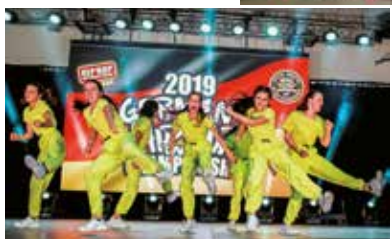
Impressive Expression Dance School, Switch Back — Junior Crew